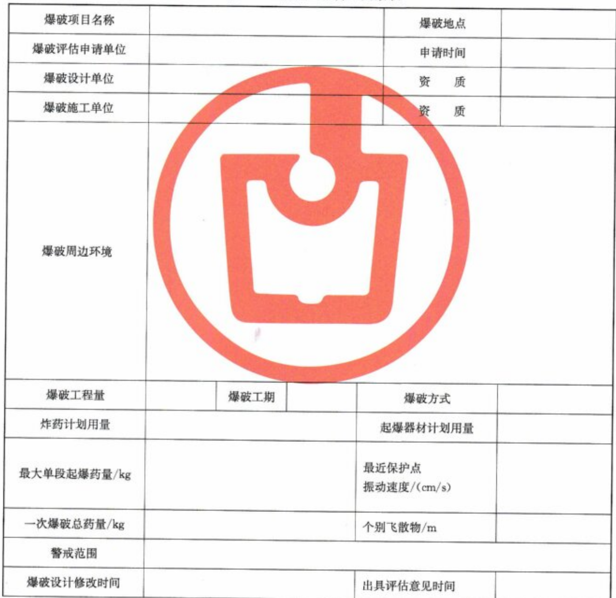
表 A.1 爆破工程管理要素表